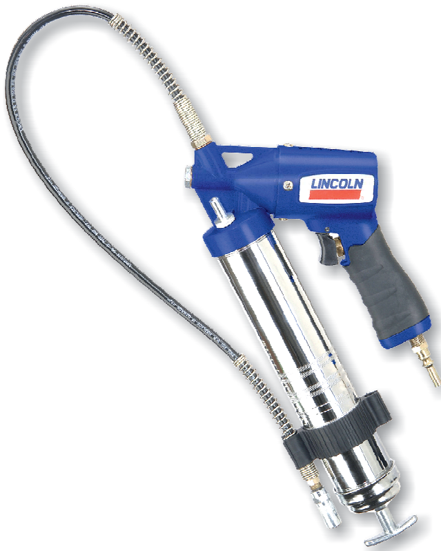
Pneumatický mazací lis 1162, obj.č. 32101

Zapsán do obchodního rejstříku u Krajského soudu v Ústí nad Labem v oddíle C, č. vložky 274